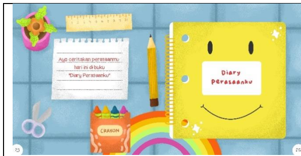
Halaman dua puluh lima dan dua puluh enam