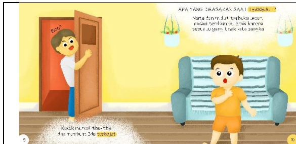
Halaman sembilan dan sepuluh