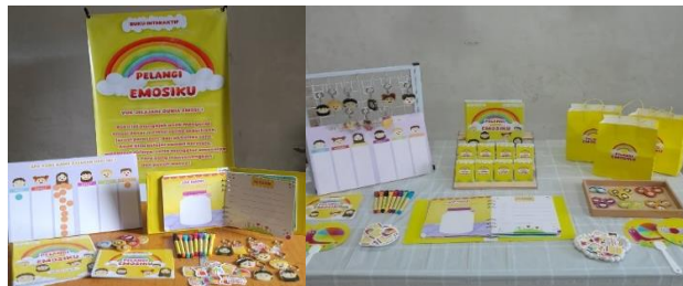
Gambar 3. Display Karya