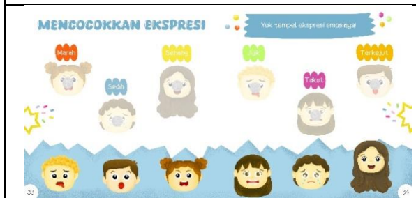
Halaman tiga puluh tiga dan tiga puluh empat