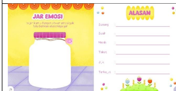
Halaman dua puluh satu dan dua puluh dua