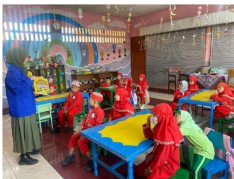
Gambar 4. Implementasi Karya

Pada tahapan ini penulis melakukan implementasi karya ke salah satu TK yang ada di kota Medan yaitu TK Aisyiyah Bustanul Atfhal 13 Medan dengan rentang usia 5-6 tahun.