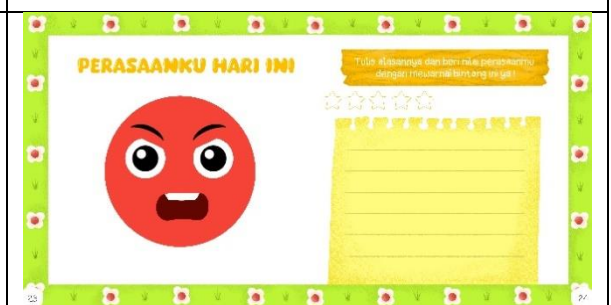
Halaman dua puluh tiga dan dua puluh empat