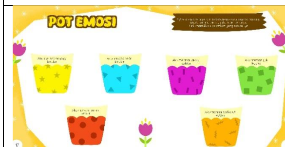
Halaman tujuh belas dan delapan belas