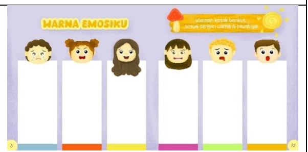
Halaman tiga puluh satu dan tiga puluh dua