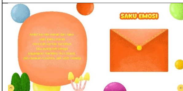
Halaman dua puluh sembilan dan tiga puluh