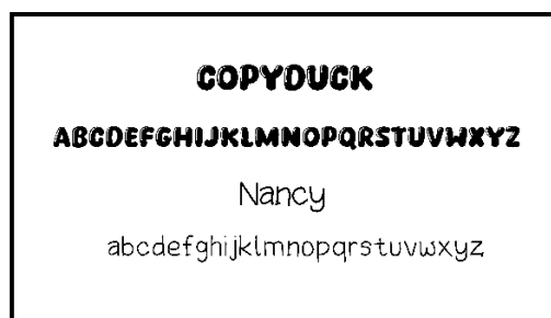
Gambar 2. Tipografi

Tipografi yang akan digunakan pada perancangan buku interaktif ini yaitu menggunakan 2 font, yaitu font copyduck dan nancy. Penulis menggunakan font ini karena terkesan cocok untuk anak dengan gaya huruf yang tebal, bulat dan playful , yang biasa digunakan untuk desain yang bersifat informal atau ramah anak.