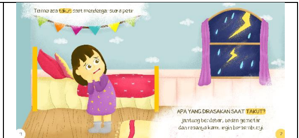
Halaman sebelas dan dua belas