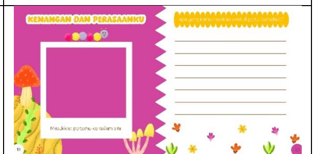
Halaman sembilan belas dan dua puluh