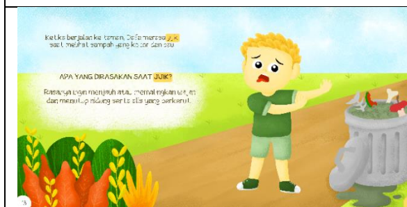
Halaman tiga belas dan empat belas