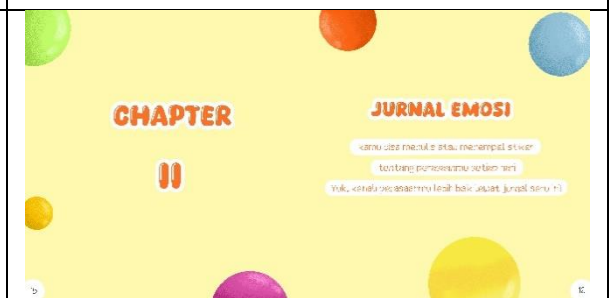
Halaman lima belas dan enam belas