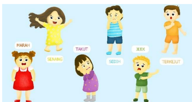
Gambar 1. Desain Karakter

Desain karakter yang telah dibuat mendefinisikan dari keenam emosi dasar manusia yang disesuaikan juga melalui ekspresi wajah dan gestur tubuhnya.