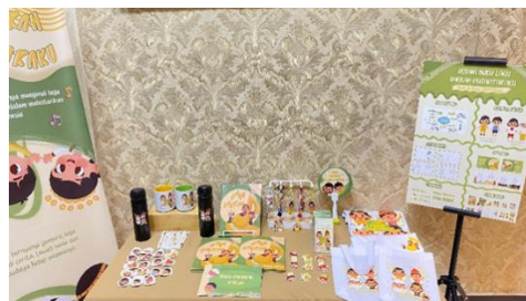
Gambar 4. Dokumentasi Display Karya

Adapun beberapa media pendukung yang pengkarya gunakan untuk membantu dalam mempromosikan media utama yaitu x banner , poster A2, stiker, manual book .