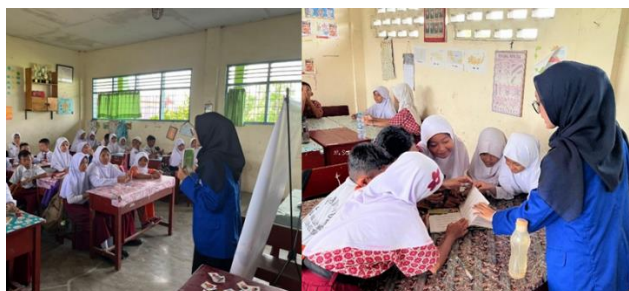
Gambar 5. Dokumentasi Memperkenalkan Buku Lagu Daerah Nusantaraku