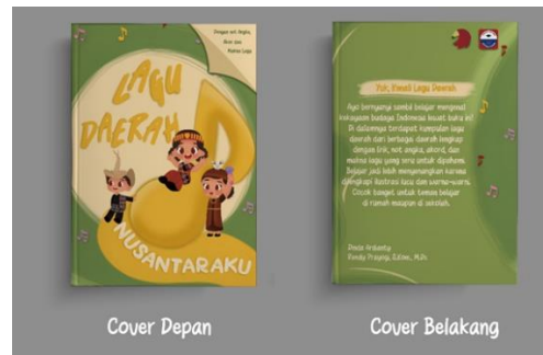
Gambar 2. Media Utama

full color. Buku ini dirancang dengan ukuran 17 x 23 cm, pada bagian cover menggunakan bahan hardcover dengan bahan laminating glossy yang memberikan kesan menarik, sedangkan untuk isi menggunakan bahan kertas konstruk 150 gr dan jumlah halaman sebanyak 88 halaman.