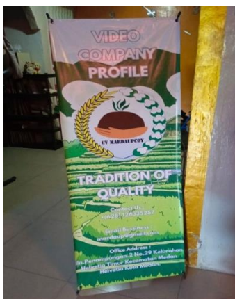
Gambar 10. X-banner sebagai Media Promosi Visual dalam Kegiatan Publik

menunjukkan peran aktif perusahaan dalam mendukung program pemerintah dan melayani kebutuhan masyarakat, khususnya di bidang pertanian. Dokumentasi ini memperkuat citra perusahaan yang profesional, peduli, dan berkontribusi langsung kepada masyarakat.