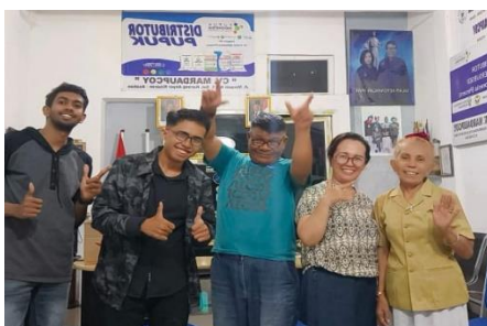
Gambar 8. Kebersamaan dan Kekompakan Tim

Pada tahap awal, seluruh anggota tim CV Mardaupcoy mengadakan rapat internal. Diskusi ini membahas konsep dasar, ide, dan struktur company profile yang akan disusun. Suasana terlihat serius namun tetap kondusif, dimana sebagian anggota melakukan pencatatan dan lainnya memantau informasi melalui gawai. Dokumentasi ini menjadi bukti adanya proses perumusan awal sebelum company profile dirancang lebih lanjut.