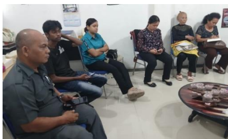
Gambar 7. Rapat Internal Tim

Dalam proses perancangan company profile, tim CV Mardaupcoy melakukan beberapa tahapan kegiatan yang terdokumentasi melalui beberapa foto berikut :