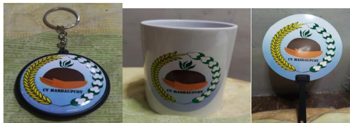
Gambar 6. Merchandise

panjang gagangnya sekitar 10 cm. Jika digabung, total panjang kipas tangan dari ujung atas sampai ujung gagang adalah 30 cm. Gantungan kunci berbentuk bulat pipih dengan ring besi kecil di bagian atas. Diameternya sekitar 5 cm dan ketebalannya sekitar 1 cm. Ukurannya kecil sehingga praktis dibawa dan mudah dipasang pada kunci.