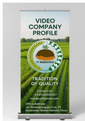
Gambar 5. X-banner