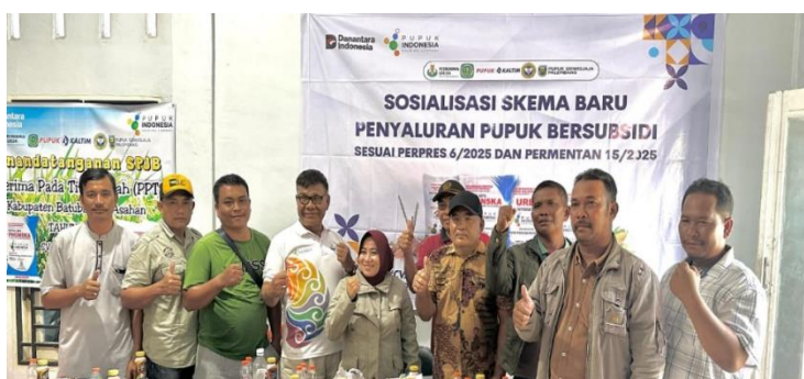
Gambar 9. Kegiatan Eksternal: Sosialisasi Program

Setelah rapat selesai, tim mengabadikan momen kebersamaan dengan penuh antusiasme. Foto ini menggambarkan kekompakan, keakraban, dan semangat positif dari seluruh anggota. Dokumentasi ini menegaskan bahwa perancangan company profile tidak hanya sebatas teknis, namun juga melibatkan kolaborasi tim yang solid.