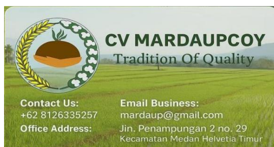
Gambar 3. Kartu Nama