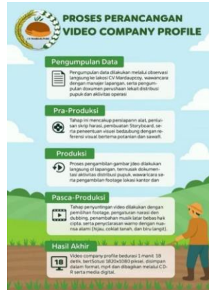
Gambar 4. Poster proses perancangan