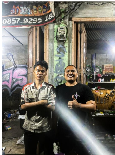
Gambar 1. Observasi Lapangan Pengumpulan Bengkel SJS

interaksi dengan pelanggan. Wawancara dilakukan dengan pemilik bengkel untuk menggali informasi mendalam terkait kebutuhan edukasi otomotif. Data sekunder adalah data tambahan atau dari pihak kedua yang bukan dari objek penelitian secara langsung. Data sekunder bisa didapatkan dari buku, jurnal, internet dan penelitian sebelumnya. Penulis menjadikan buku fotografi dari panggung ke panggung dan buku dari merawat dan memperbaiki sepeda motor sebagai suatu media sekunder dalam perancangan majalah edukasi otomotif melalui visual fotografi.