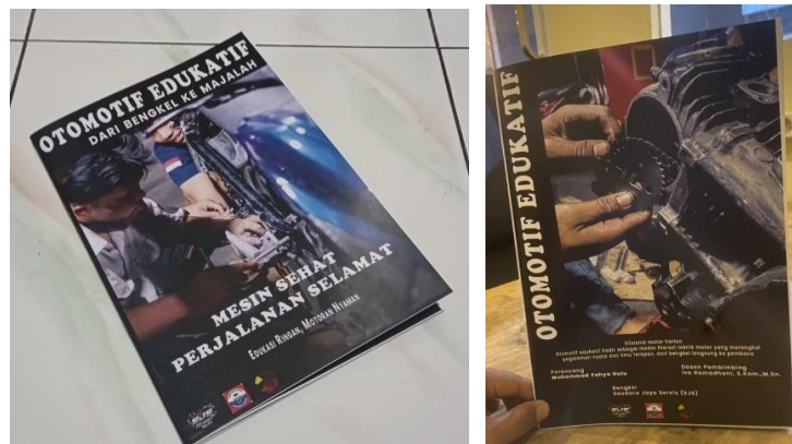
Gambar 2. Hasil Rancangan Majalah Otomotif

keseimbangan antara teks dan gambar untuk mempermudah pemahaman pembaca. Selain itu, majalah dilengkapi dengan tips perawatan kendaraan, informasi batas usia pakai suku cadang, dan panduan servis berkala. Adapun hasil dari sebuah majalah otomotif sebagai berikut