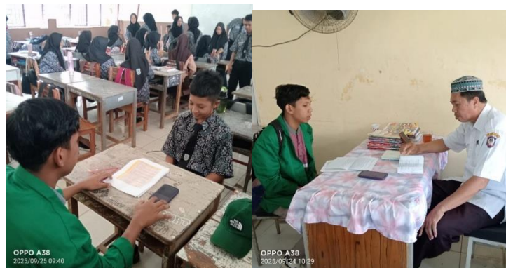
Gambar 3. Wawancara Mendalam

Berdasarkan analisis data kualitatif dari wawancara mendalam dengan siswa, guru PAI, dan orang tua, teridentifikasi bahwa faktor-faktor penghambat kemampuan membaca Al-Qur'an didominasi oleh aspek internal dan eksternal yang saling berinteraksi. Secara internal, Rendahnya Minat dan Motivasi Diri ditemukan sebagai penghambat paling signifikan, dialami oleh 85% siswa yang dikategorikan berkemampuan rendah. Minat yang rendah ini dikonfirmasi melalui observasi penggunaan waktu luang, di mana rata-rata siswa menggunakan waktu lebih dari 4 jam per hari untuk bermain game online atau berselancar di media sosial, sejalan dengan temuan Azahro (2023) mengenai dampak masif teknologi yang menyebabkan pergeseran prioritas waktu dan fokus. Siswa seringkali mengakui bahwa mereka merasakan beban daripada kebutuhan spiritual saat harus membaca Al-Qur'an. Selain itu, faktor psikologis seperti rasa malu saat harus membaca di depan umum menjadi penghambat kuat, terutama bagi siswa yang kemampuan dasarnya lemah, membuat mereka cenderung menarik diri dari sesi praktik tilawah (Solihin et al., 2024).