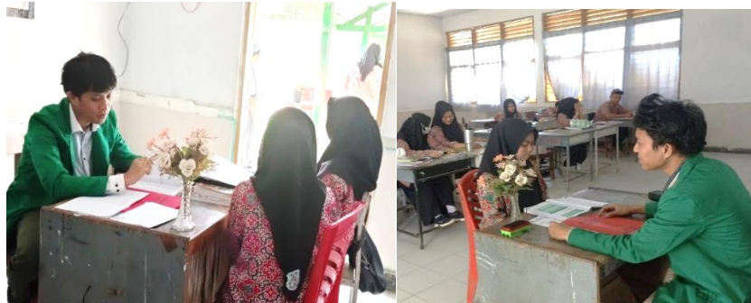
Gambar 2. Tes Kemampuan Membaca Al Qur'an

Berdasarkan analisis data kualitatif dari wawancara mendalam dengan siswa, guru PAI, dan orang tua, teridentifikasi bahwa faktor-faktor penghambat kemampuan membaca Al-Qur'an didominasi oleh aspek internal dan eksternal yang saling berinteraksi. Secara internal, Rendahnya Minat dan Motivasi Diri ditemukan sebagai penghambat paling signifikan, dialami oleh 85% siswa yang dikategorikan berkemampuan rendah. Minat yang rendah ini dikonfirmasi melalui observasi penggunaan waktu luang, di mana rata-rata siswa menggunakan waktu lebih dari 4 jam per hari untuk bermain game online atau berselancar di media sosial, sejalan dengan temuan Azahro (2023) mengenai dampak masif teknologi yang menyebabkan pergeseran prioritas waktu dan fokus. Siswa seringkali mengakui bahwa mereka merasakan beban daripada kebutuhan spiritual saat harus membaca Al-Qur'an. Selain itu, faktor psikologis seperti rasa malu saat harus membaca di depan umum menjadi penghambat kuat, terutama bagi siswa yang kemampuan dasarnya lemah, membuat mereka cenderung menarik diri dari sesi praktik tilawah (Solihin et al., 2024).